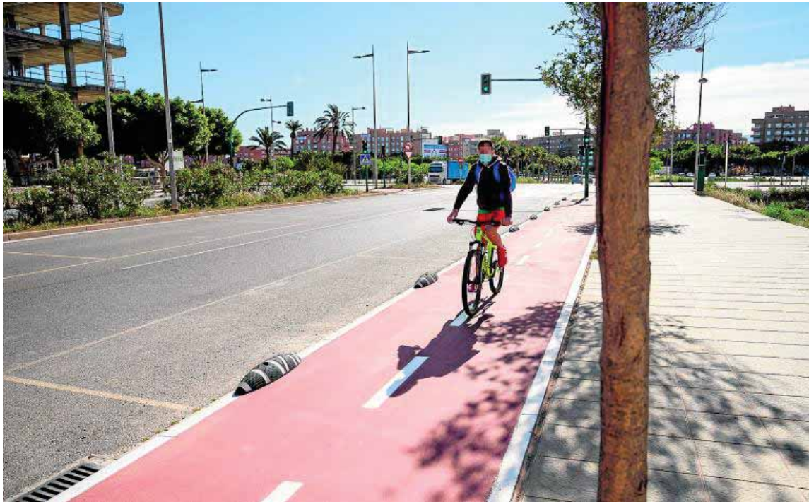
Tramo de la red de carril bici de la ciudad de Almería.