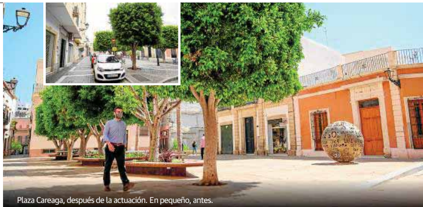
Plaza Careaga, después de la actuación. En pequeño, antes.

Otro de los proyectos ya concluidos ha sido el de la creación de nuevo espacio mejorado en el Centro Histórico de Almería, en concreto en la plaza Careaga, que ha sufrido una nueva transformación en la que se ha dado prioridad al peatón.