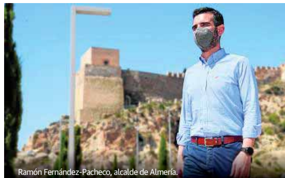
Ramón Fernández-Pacheco, alcalde de Almería.

El alcalde de Almería, Ramón Fernández-Pacheco se muestra «muy satisfecho» por la marcha de los diferentes proyectos incluidos en la Estrategia de Desarrollo Urbano Sostenible -DUSI-. Muchos de ellos son ya una realidad que confirma la modernidad y puesta al día de Almería a través de una inversión que supera los 18 millones de euros