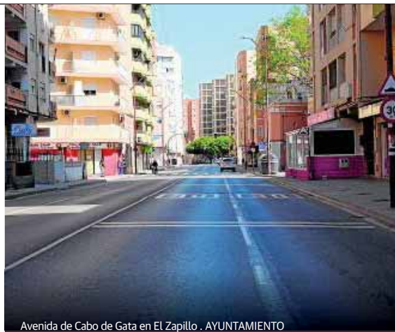
Avenida de Cabo de Gata en El Zapillo. AYUNTAMIENTO

En este sentido, se contempla la posibilidad de peatonalizar algunos espacios, reubicar vehículos y orde-