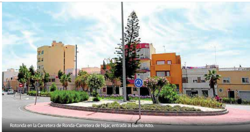
Rotonda en la Carretera de Ronda-Carretera de Níjar, entrada al Barrio Alto.

El resultado de la actuación que el Ayuntamiento ha realizado en el entorno de La Alcazaba, en concreto con la nueva conexión viaria entre las calles Pósito y Almanzor, en el pleno Centro Histórico, con casi 400 metros de nuevo vial, supone una importantísima transformación urbana acometida en el corazón del Casco Histórico y a